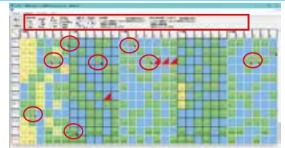
↑ 揭示用表示の自動スクロール機能