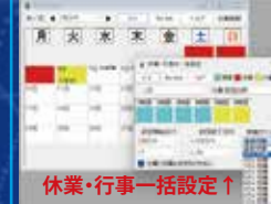
休業・行事一括設定 ↑